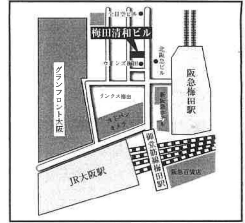
阪急・地下鉄御堂筋線「梅田」駅徒歩2分 JR線「大阪」駅徒歩3分