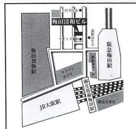
阪急・地下鉄御堂筋線「梅田」駅徒歩2分 JR線「大阪」駅徒歩3分